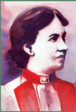
Sofia Kovalevskaja 1850-1891

Sofia Kovalevskaja a dû lutter pour poursuivre son rêve d'étudier les mathématiques à une époque où les femmes n'étaient pas admises dans la plupart des universités européennes.